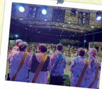
PUBILLES 25/50 ANYS